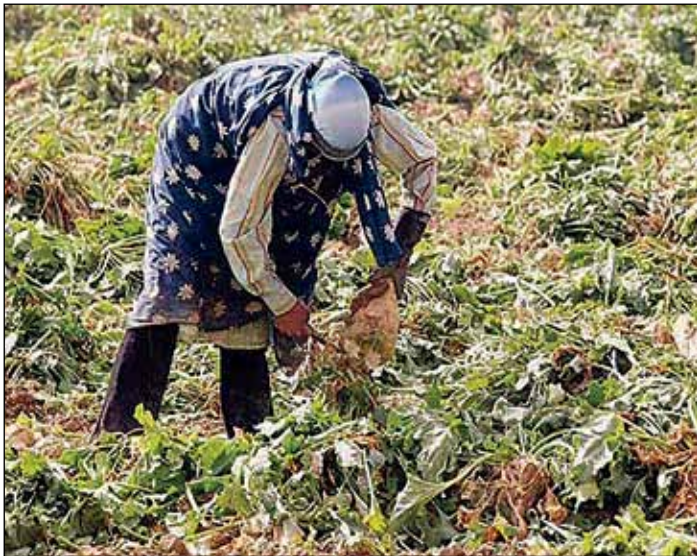
ممنوعیت بی سابقه واردات شکر